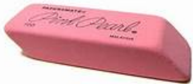
La goma de borrar